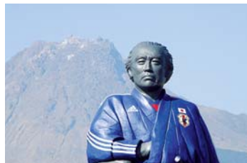
③ サムライブルー龍馬像