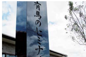
3 有馬のセミナリヨ跡地