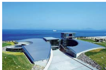
④ 雲仙岳災害記念館