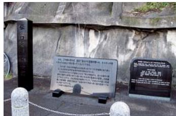
口之津歴史民俗資料館