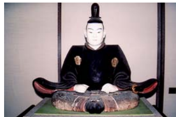
1 虚空蔵菩薩像 (ピロティ文化センター日野江2階)