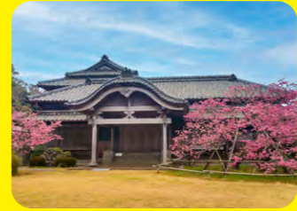
位於雲仙市國見町，建於佐賀藩神代領主一鍋島氏的兵營遺址的宅第。2007年被指定為日本國家重要文化遺產。