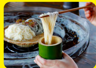
島原手擀麵線約占全日本產量的三成，久煮不爛且很有嚼勁。