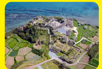
原城遺址是島原·天草武裝起義的舞台，也是世界文化遺產「長崎與天草地區隱匿基督徒相關遺產」的構成資產之一。