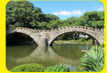
建於江戶時代，是日本規模最大的階梯式石造雙拱橋，是日本首座被指定為國家重要文化遺產的石橋。