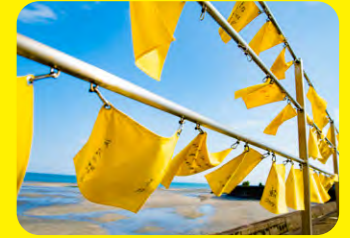
島原鐵路被譽為「日本最靠近大海的車站」。蔚藍大海、藍天與黃色手帕相映成趣的人氣景點。