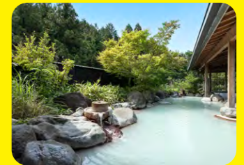
以「美肌之湯」聞名的雲仙溫泉，館內皆為源泉放流式溫泉，也推薦您品嚐以島原半島當季山鮮海產烹製的料理。