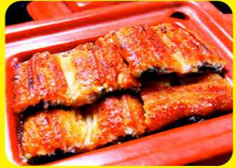
諫早名產「鰻魚」。因為諫早的蒲燒鰻魚是以雙層底的粗陶器蒸製的，因此口感鬆軟細膩、入口即化。