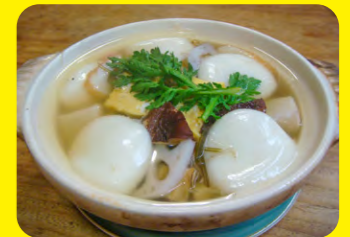
島原的「雜煮」(煮年糕)配料豐富，據說起源於島原·天草武裝起義時期，將年糕與山鮮海產一同食用。