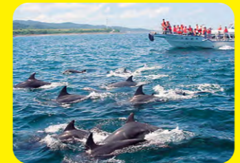
早崎海峽中長年棲息著約200隻野生海豚。一整年都觀賞得到。