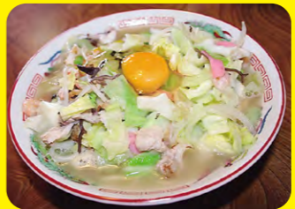
日本三大強棒麵之一，有豐富海鮮與蔬菜的強棒麵，可選擇加蛋的配料。