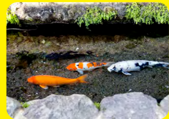
因島原市湧泉豐富，這一帶有全長100公尺的水道，因此被稱為「鯉魚悠游的城鎮」。