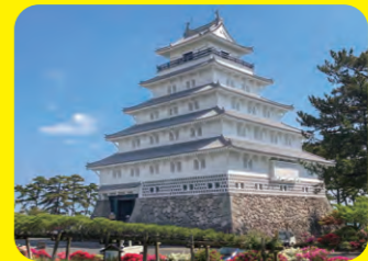
島原城由松倉豐後守重政自1618年(元和4年)起歷時約7年建成。1964年復原了「天守閣」。