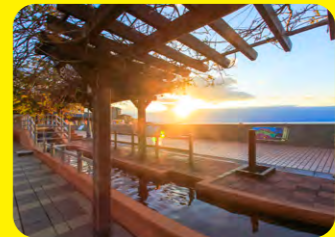
以小濱溫泉105℃的源泉溫度命名，全長105公尺，是日本最長的足湯設施。