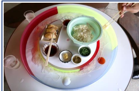
③ 宇土出口そうめん流し (本村商店) 島原の夏なら やっぱり! そうめん流し

Tel.0957-78-2554 営業時間 9:00~19:00 定休日 元旦のみ