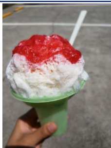
① 狸山まんじゅう 大人気のかき氷を食べる!