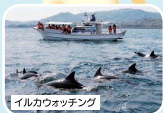
イルカウォッチング