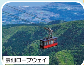
雲仙ロープウェイ