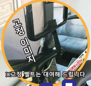
※고정벨트는 대여해 드립니다